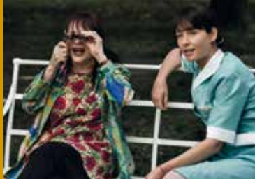
NOME DI DONNA (IT 2018)