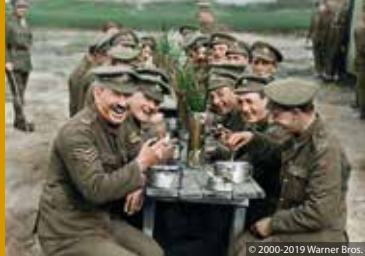
THEY SHALL NOT GROW OLD (US 2018)