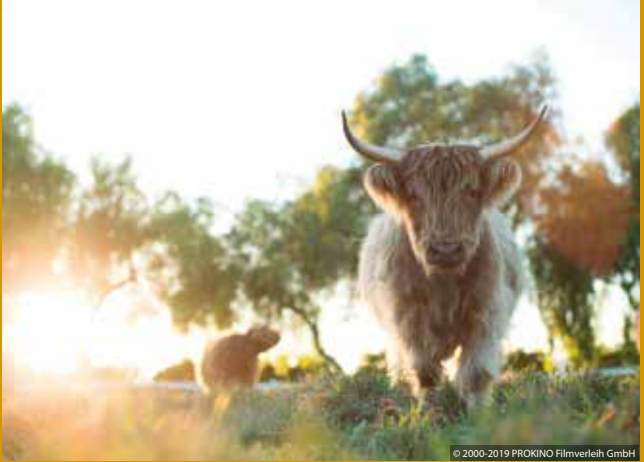
UNSERE GROSSE KLEINE FARM (US 2018)

Murnaustraße 6 | 65189 Wiesbaden | gegenüber Kulturzentrum Schlachthof