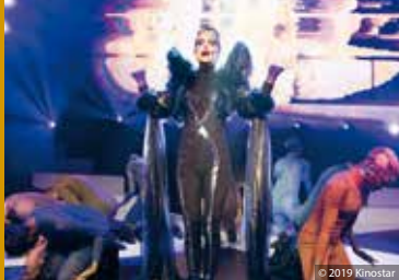
Vox Lux (US 2018)