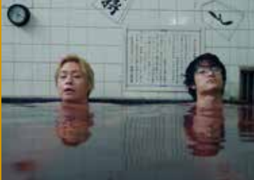
MELANCHOLIC (JP 2018)