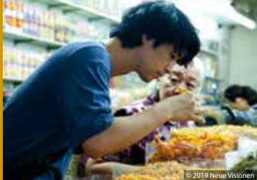
RAMEN SHOP (JP/SG/FR 2018)